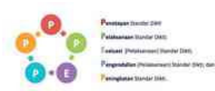
Gambar 1. Siklus SPMI